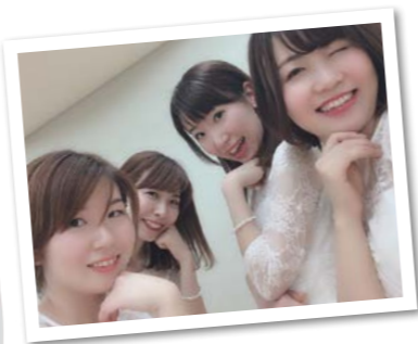
ライブイベント前にメンバーと。ステージでは、アイドルグループの振り付けを披露しました。「初心者でもステージに立ちたいという夢が叶いました」